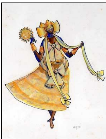
“Oxum” ; desenho da série Iconografia dos Deuses Africanos.

A primeira obra é do artista baiano que traz em sua arte a revelação do seu imaginário, repleto de figuras místicas. A segunda obra é do artista argentino naturalizado brasileiro que se apaixonou pela diversidade da cultura brasileira.