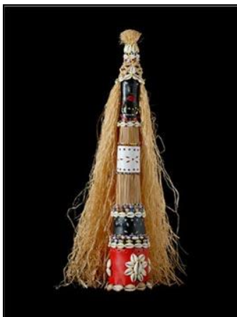
Sasará Ati Aso Iko – Xaxará com manto de palha da Costa. 2003. Técnica Mista.

As imagens a seguir contextualizam as questões 34 e 35. Observe-as atentamente.