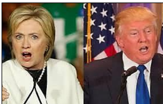
(Disponível em: http://www.emtempo.com.br/tags/donald-trump/ .)

“Após dois mandatos, Barack Obama não poderá concorrer a mais uma prolongação de sua estadia na Casa Branca em 2016. Acontecendo tradicionalmente na primeira terça-feira de novembro, as eleições presidenciais americanas têm sido, desde 1856, dominadas por dois grandes partidos. Segundo o think-thank partidário PEW Research Center, a população americana vive uma onda crescente de partidarização. O mesmo pode ser dito nas outras esferas federais da política: tanto a Câmara do Senado quanto a dos Representantes, que compõem o Congresso americano, vivem um momento de polarização como não visto desde o final do século XIX.”