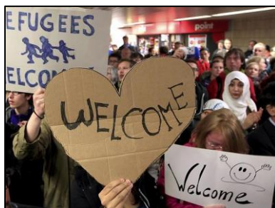
Grupo de refugiados é recebido com faixas de boas-vindas em estação ferroviária da Alemanha.

País abriu fronteiras para receber imigrantes de países em crise. Entre sábado e domingo, foram mais de 13 mil pessoas transportadas.