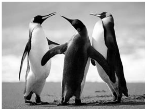
Figura 1 PINGUINS

38. Uma estudante de biologia está confeccionando um artigo científico no Word 2010, em sua configuração padrão. Uma das exigências da revista para publicar o artigo é que todas as imagens estejam numeradas e com nome. Para automatizar este trabalho, a estudante optou por utilizar o recurso “Inserir Legenda”, que além de numerar automaticamente a figura também é possível dar nome a ela. Assinale a alternativa que corresponda ao local para acessar esta ferramenta.