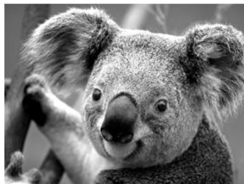
Figura 2 COALA